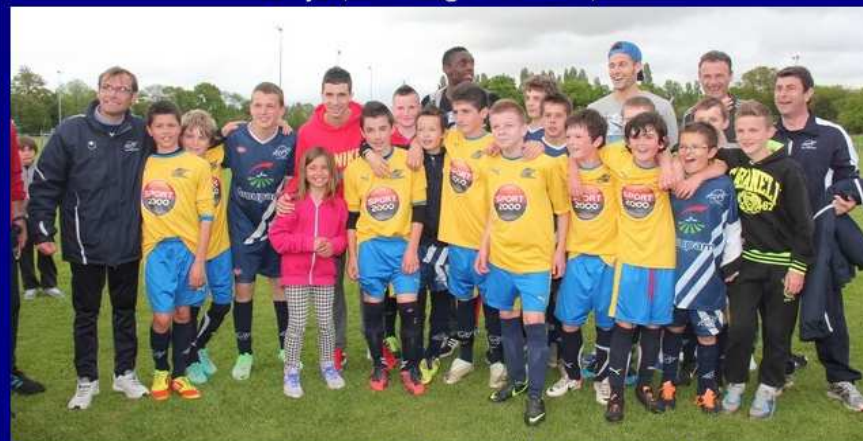
avec l'équipe de Vignoc-Hédé-Guipel qui s'est imposée en U13 face à Pornichet.