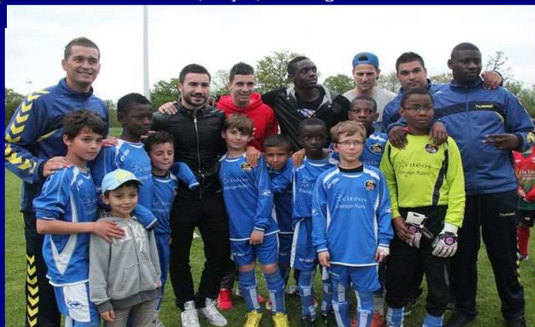
célébrent la victoire en U11 de Pontault Combault.